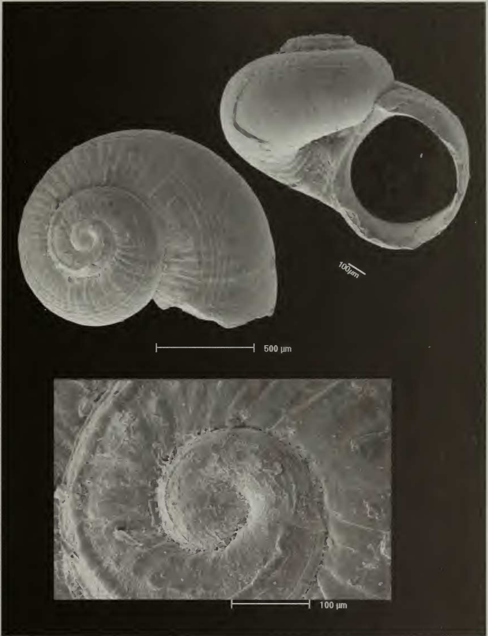
Lámina 1.- Emiliotia immaculatus , especie nueva.